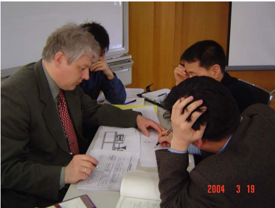
Консультация слушателей после лекции.