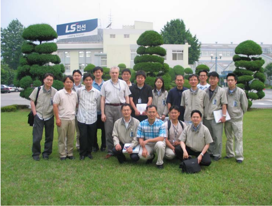
Группа слушателей семинара «ФСА+ТРИЗ» компании LS Cable (июнь 2005).