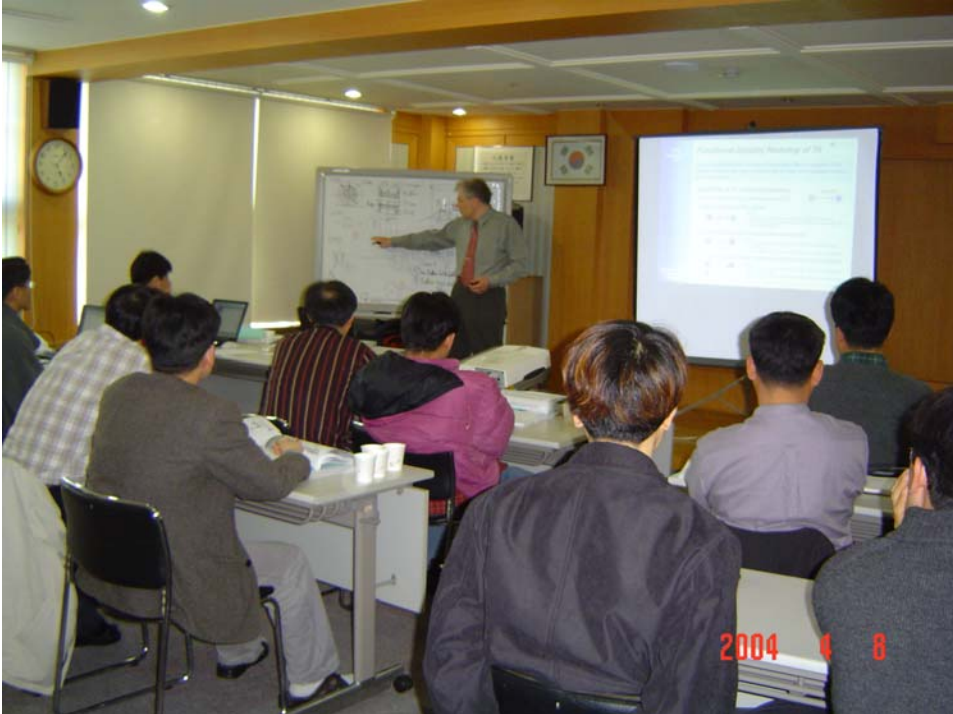
Лекция. Демонстрация работы инструментов ТРИЗ на задаче слушателя.